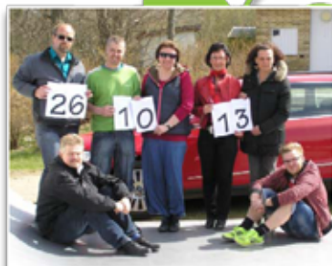
Arranger: Blicheregnens Festudvalg anno 2007