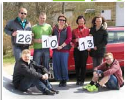
Arrangør: Blicheregnsens Festudvalg anno 2007