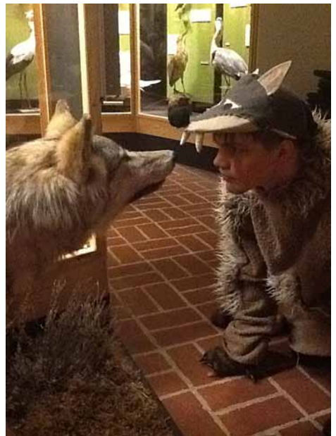
Ulven bor på museet.