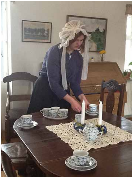
Stemming fra Blichers tid