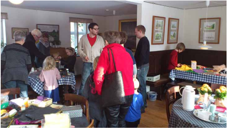
Vinterferien på museet