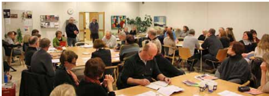
Mange var mødt op til Hilsen-på-aften

Se mere på www.thorning.com Erling Prang