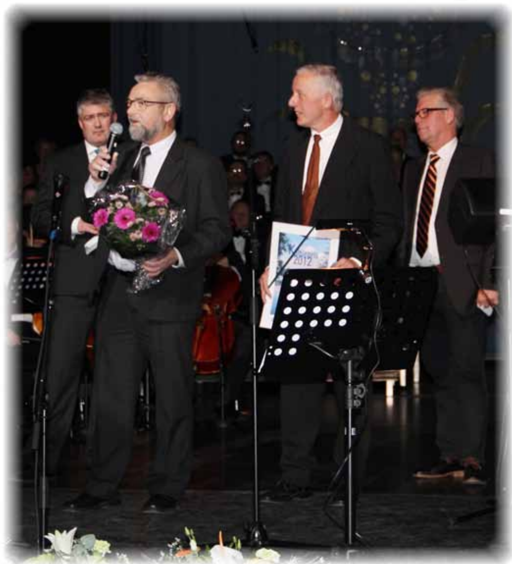
Silkeborg Kommunes Kulturpris 2012