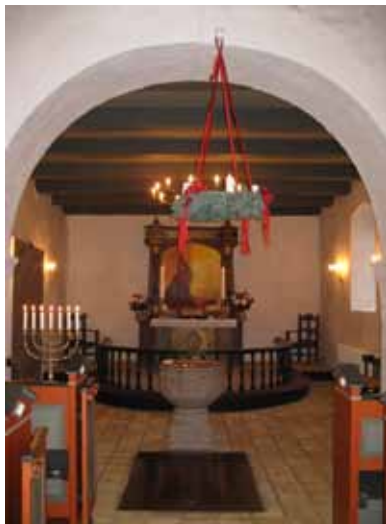
1. søndag i advent i Thorning kirke