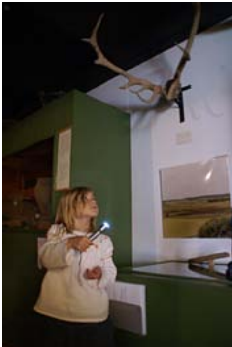
Ophelia med sin lommelygte. Fra tidligere "Nat på Museet".