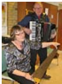
To fra Lysbro

Onsdag den 12. november kl. 14.00 er der bankospil på Bakkegården med fine gevinster.