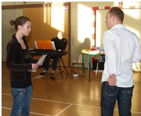
En scene fra Audition

Efter et skuespillerkursus i januar er alle klar til øveforløbet, som starter den 5. marts. Hermed er øveforløbet kortet en del ned, og der øves koncentreret i marts, april og maj og vi glæder os til at være klar til premieren den 6. juni. Deltagerne på og omkring scenen kan se frem til nogle spændende og sjove timer sammen i et godt kammeratskab, en god ånd og en fantastisk arbejdsiver.