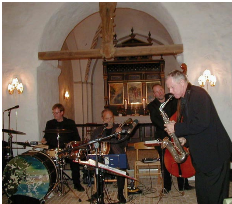
Jazzkvarteret Red Hot Four

Alle, der har tid og lyst til at deltage, er meget velkomne!